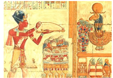
The pharaoh makes an offering to the ship of Amun-Re: from the Memnonium at Abydos (13th century BC).

Images of feet are found in sanctuaries in a number of ancient religious traditions, and some modern ones. These have sometimes been thought to represent the feet of pilgrims on their journey. However, this view has been challenged, and it has been argued that feet symbolise presence, either that of the deity or of the worshipper, whether local or visiting. In this paper I suggest that this reaction may have gone too far, and there may after all be a relationship between foot dedications and pilgrimage.