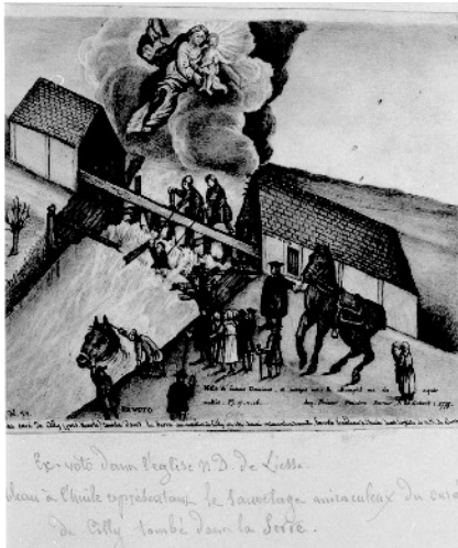
« Ex-voto à Notre-Dame de Liesse du curé de Cilly, sauvé de la noyade en 1775 ».

Les ex-voto gratulatoires sont souvent déposés dans les sanctuaires de pèlerinage, lieux où l'on vient pour obtenir une faveur. Deux sources nous permettent de les appréhender, qui apportent des renseignements différents et quelquefois contradictoires sur ce geste. Ces sources sont des imprimés : les livrets dont un chapitre