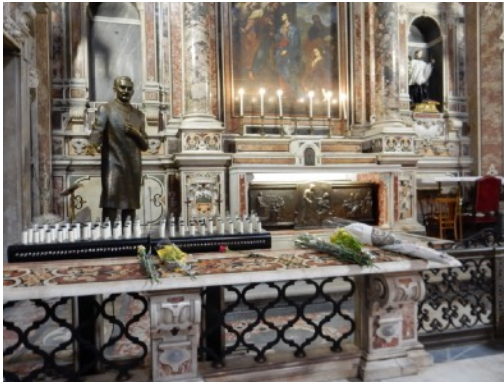
Tombeau et statue de S. Giuseppe Moscati, église du Gesù Nuovo, Naples, 2021.

L'église du Gesù Nuovo, dans le centre historique de Naples, abrite le corps de Giuseppe Moscati (1880-1927), médecin canonisé en 1987. Dans cette église, on trouve deux lieux dédiés au saint et différents types de dépôts votifs. Une chapelle accueille le tombeau de Moscati et une statue grandeur nature, représentant le saint avec sa blouse de médecin et son stéthoscope. Avant que la pandémie de la Covid-19 n'éclate, les fidèles pouvaient toucher la statue. Aujourd'hui, ils peuvent seulement allumer une bougie électrique ou laisser des fleurs devant la chapelle. Ensuite, dans l'oratoire de l'église, on trouve une