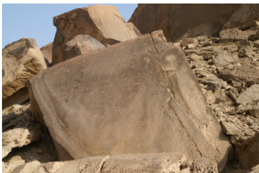
Graffiti arabes dans la région de Dumat al-Jandal (Nord de l'Arabie Saoudite).