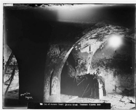
Petra. Aaron's Tomb, interior, Matson Photograph Collection, American Colony, Jerusalem.

Jusqu'au début du XX e siècle, le pèlerinage au tombeau du nabī Hārūn (Aaron) était l'un des lieux saints les plus vénéérés du sud de la Transjordanie ottomane. Outre des