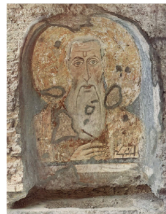
Fresque-icône de saint Cyr, atrium de l'église Santa Maria Antiqua, Rome.

Dans les Miracles de Cyr et Jean , composés en Égypte par le futur patriarche de Jérusalem Sophrone au VII e siècle, se trouve la description de la pratique par laquelle des individus appartenant généralement à des couches sociales marginales se prêtaient, de manière apparemment professionnelle, à se rendre dans le sanctuaire des deux saints (à Ménouthis, à quelques km d'Alexandrie), afin de déposer des ex-voto au nom de personnes ayant bénéficié d'un miracle de la part des saints, mais qui, pour des raisons diverses, ne pouvaient pas s'y rendre personnellement. Sophrone insère la description de ces pratiques dans un cadre narratif