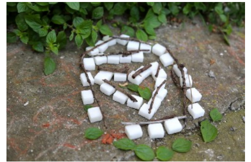
Voeu éphémère et "bricolé" dans l'enceinte du monastère de Saint-Georges (Istanbul).

Cette intervention sera accompagnée de photographies et de courtes séquences filmées.