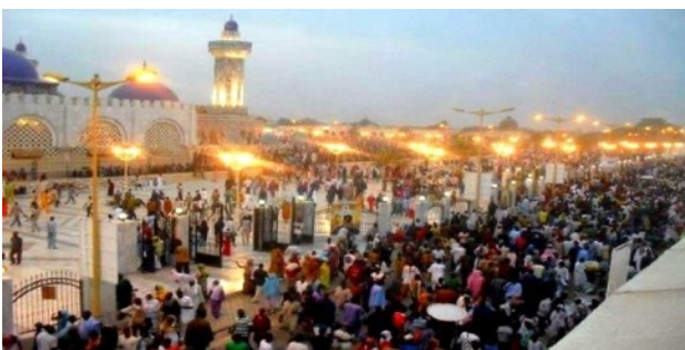
Magal de Touba.

recomposé au gré des fluidités migratoires de ses acteurs, taalibés et cheikh-s. Événement devenu majeur dans la vie religieuse de la confrérie, le grand magal de Touba, principal pèlerinage mouride, est un bon analyseur des transformations de ce mouvement religieux contemporain. Il permet de comprendre ce que les taalibés mourides investissent et recomposent, matériellement et symboliquement, dans leurs pratiques religieuses et dans les rituels qu'ils mettent en œuvre, et d'observer comment ces constructions subjectives du croire alimentent