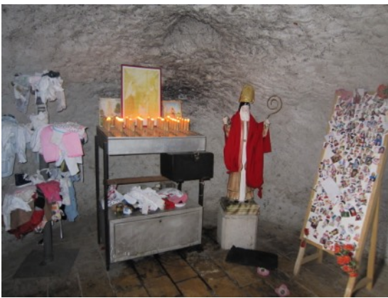
Les ex-voto de la grotte chapelle Maronite de Mar Abda El Mouchammar (St Abdon), Zikrit, Liban.

Au Liban, le culte des saints draine de nos jours, comme depuis des siècles, l'essentiel