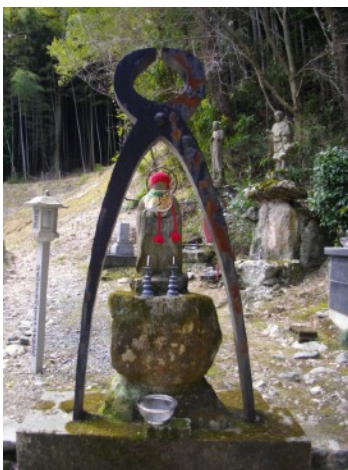
Kugi-nuki Jizō : bodhisatva Jizō (Kṣitigarbha) « qui ôte les clous » (du karma et de la maladie) à la station n°20 (Kakurin-ji) du circuit de pèlerinage de Sasaguri, statue offerte par un pèlerin en 1932.

Au Japon comme ailleurs, l'espace de pèlerinage est géré par une ou plusieurs institutions religieuses et économiques qui ont la main mise sur le circuit et autorité sur la manière de faire le pèlerinage et d'y accéder : temples bouddhiques, assemblées de responsables d'oratoires, ou encore, confréries locales vont accueillir les pèlerins, baliser leur parcours et faire observer une certaine orthopraxie. Ils décident qui peut prétendre à l'appellation de « pèlerin » et entrer sur certains espaces, contrôlent et gèrent le dépôt d'objets (cartes de pèlerins, plaquettes, copies de sūtra, statues et autres objets religieux) dans les lieux de culte. Malgré tout, ces prescriptions ne sont pas suivies par tous. L'espace culturel fait l'objet de tensions et de négociations constantes entre acteurs religieux institutionnels, laïcs (hôteliers, commerçants, confréries) et fidèles/pèlerins venus de l'extérieur. Comment les acteurs du pèlerinage, religieux et institutionnels, négocient-ils avec les visiteurs qui font vivre le circuit ?