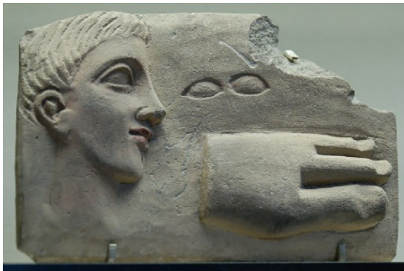
Plaque votive anatomique I er s. ap. J.-C., Chypre, © Musée du Louvre.

b. Transformations corporelles. Modératrice : Clarisse Prêtre (CNRS, Paris).