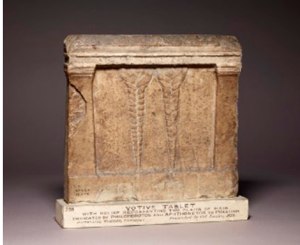
Stèle votive à Poséidon de Thèbes de Phthiotide (British Museum).

Au Proche-Orient et dans le monde grec, les consécration de cheveux à la suite d'un vœu sont attestées par les sources textuelles et les documents figurés. En étudiant le déroulement du rituel, on tentera de mettre en évidence comment ces offrandes s'inscrivent dans un cadre contractuel entre le dédicant et la divinité.