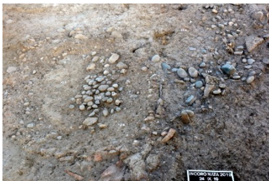
Incoronata. Contexte rituel du VII e siècle av. J.-C., Photo M. Denti.

Démolir, fragmenter et enfouir sous terre dans le monde ancien. La destruction des objets et des monuments comme pratique rituelle de conservation.