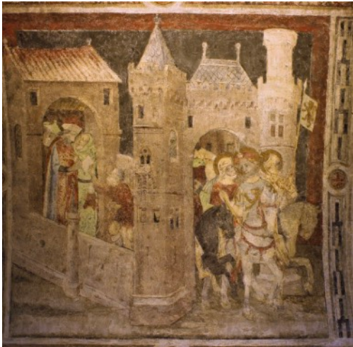
Les trois Doms, fresque de la collégiale Saint-Barnard, Romans-sur-Isère.

Le mystère comme geste votif (France, XV e -XVI e siècles) : quand jouer c'est croire, quand jouer c'est donner.