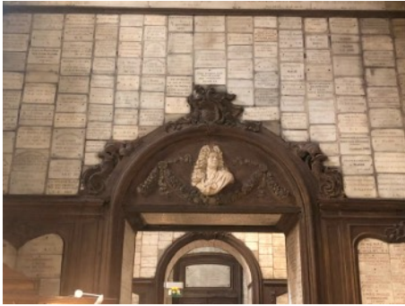
Notre-Dame des Victoires, vue intérieure.

La basilique Notre-Dame des Victoires, monument issu d'un vœu de Louis XIII, après le Siège de la Rochelle (1627-1628), mais achevé sous le règne de Louis XIV, puis sanctuaire pour le père et la mère de Thérèse de Lisieux, est aussi un immense dépôt, entièrement tapissé de milliers de plaques votives et encore actif aujourd'hui. On s'intéressera dans cette enquête, au-delà de l'histoire de ce site et de ces ex-voto, aux procédures qui règlent actuellement la pose des plaques : les demandeurs, les relais dans la paroisse, les rituels de pose eux-mêmes.