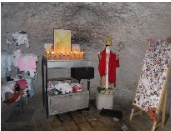
Les ex-votos de la grotte chapelle Maronite de Mar Abda El Mouchammar (St Abdon), Zikrit, Liban

Au Liban, le culte des saints draine de nos jours, comme depuis des siècles, l'essentiel