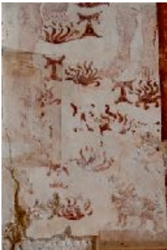
Peinture murale de l'église de Préhy (Yonne) ; début du XVI e siècle. On reconnaît le tau de saint Antoine, réputé guérir du mal des ardents et les ex voto anatomiques en cire déposés par les malades.