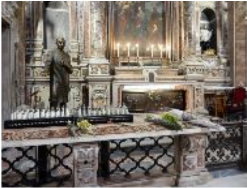
Tombeau et statue de S. Giuseppe Moscati, église du Gesù Nuovo, Naples, 2021.

L'église du Gesù Nuovo, dans le centre historique de Naples, abrite le corps de Giuseppe Moscati (1880-1927), médecin canonisé en 1987. Dans cette église, on trouve deux lieux dédiés au saint et différents types de dépôts votifs. Une chapelle accueille le tombeau de Moscati et une statue grandeur nature, représentant le saint avec sa blouse de médecin et son stéthoscope. Avant que la pandémie de la Covid-19 n'éclate, les fidèles pouvaient toucher la statue. Aujourd'hui, ils peuvent seulement allumer une bougie électrique ou laisser des fleurs devant la chapelle. Ensuite, dans l'oratoire de l'église, on trouve une