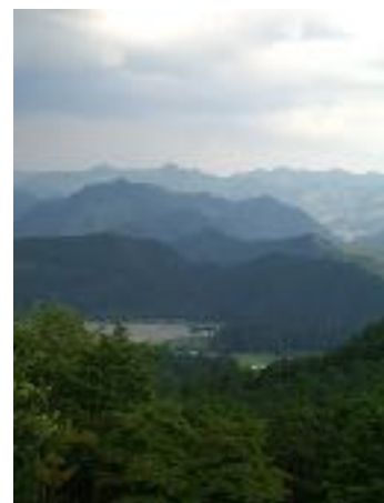
Arrivée par la route de Kohechi au sanctuaire de Hongû (dep. Wakayama), août 2006

La dévotion pèlerine dans le Japon de Heian (984-1185) constitue un phénomène social important de la vie de l'aristocratie de cour. Les voyages de la foi conduisaient une foule nombreuse vers les sanctuaires shintô ou les temples bouddhiques, bien que cette distinction ne soit pas d'une grande pertinence tant l'interpénétration et la combinaison des deux systèmes religieux était grande à cette époque. Les pèlerinages vers les lieux éloignés de la capitale étaient souvent placés, sans que cela ne soit systématique, sous le patronage de moines chargés de guider les voyageurs jusqu'au lieu saint. Ces religieux insufflèrent une dimension ascétique à ces déplacements : les dévots devaient se plier à une période de réclusion avant et après le pèlerinage, ils effectuaient de nombreux