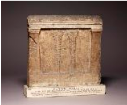
Stèle votive à Poséidon de Thèbes de Phthiotide (British Museum)

Les ex-voto capillaires dans l'Antiquité.