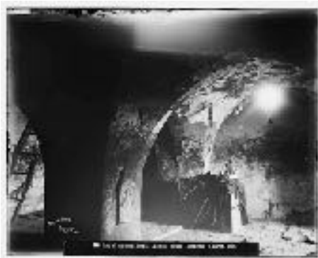
Petra. Aaron's Tomb, interior

Jusqu'au début du XX e siècle, le pèlerinage au tombeau du nabī Hārūn (Aaron) était l'un des lieux saints les plus vénérés du sud de la Transjordanie ottomane. Outre des