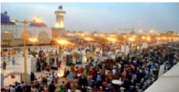
Magal de Touba.

Né d'un mouvement religieux local apparu dans le contexte colonial perturbé de la fin du dix-neuvième siècle au Sénégal, le mouridisme a été initié par un saint soufi, Cheikh Ahmadou Bamba. Le mouridisme aujourd'hui est devenu emblématique d'un mouvement religieux contemporain en pleine expansion qui s'est internationalisé et