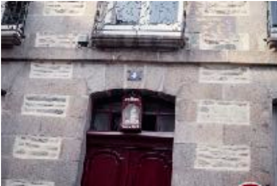
Rennes, 4 rue Saint-Sauveur : une "niche à Vierge" fait état de "voeux" au pluriel : celui qui fut formulé lors du choléra de 1849 mais aussi l'incendie de 1720 qui s'arrêta à cet endroit.

Face aux malheurs des temps, particulièrement les épidémies et les incendies, les villes