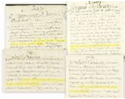
Signalements de bagnards tatoués, Brest, vers 1750. Registres du Baigne de Brest numérisés par le Service historique de la défense. Dépouillement et repérage L. Renaut

d'autres signes », assortissant leur offre d'une menace : « Celui qui ne se les fait pas dans ce monde-ci, on les lui fera dans l'autre avec une pioche ». Cette pratique originale, à première vue isolée, sera analysée en lien avec d'autres types de marquage, analogues ou alternatifs, corporels et/ou spirituels, qui se développent à la même époque en Europe et répondent à une forte demande dévotionnelle, à la fois religieuse et sentimentale. Selon toute vraisemblance, ce sont ces pratiques de dévotion personnelle et interpersonnelle qui sont à l'origine de l'essor du tatouage en Occident.