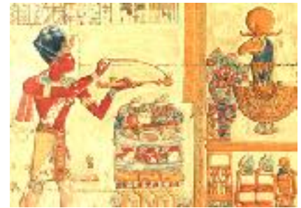
The pharaoh makes an offering to the ship of Amun-Re: from the Memnonium at Abydos (13th century BC)

Images of feet are found in sanctuaries in a number of ancient religious traditions, and some modern ones. These have sometimes been thought to represent the feet of pilgrims on their journey. However, this view has been challenged, and it has been argued that feet symbolise presence, either that of the deity or of the worshipper, whether local or visiting. In this paper I suggest that this reaction may have gone too far, and there may after all be a relationship between foot dedications and pilgrimage.