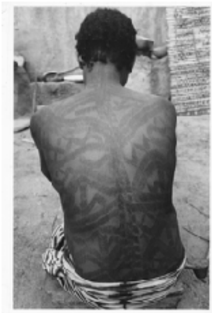
Photo : Femme bwano de la région de Houndé (Burkina Faso). Cliché datant des années 1980.

Les pratiques de marquage corporel par scarification étaient encore courantes en Afrique subsaharienne jusqu'à la fin du siècle dernier. Dans certains cas, ces marquages