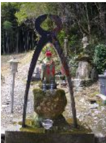
Kugi-nuki Jizō : bodhisatva Jizō (Kṣitigharba) « qui ôte les clous » (du karma et de la maladie) à la station n°20 (Kakurin-ji) du circuit de pèlerinage de Sasaguri, statue offerte par un pèlerin en 1932.

Au Japon comme ailleurs, l'espace de pèlerinage est géré par une ou plusieurs