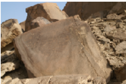
Graffiti arabes dans la région de Dûmat al-Jandal (Nord de l'Arabie Saoudite).