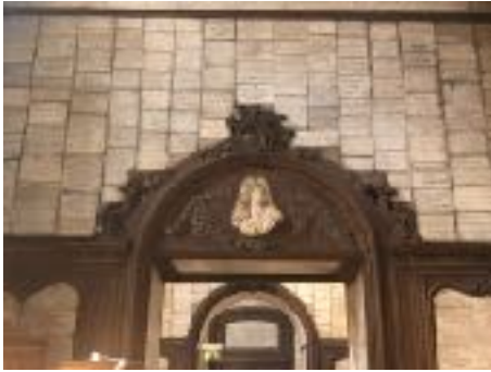
Notre-Dame des Victoires, vue intérieure.

La basilique Notre-Dame des Victoires, monument issu d'un vœu de Louis XIII, après le Siège de la Rochelle (1627-1628), mais achevé sous le règne de Louis XIV, puis sanctuaire pour le père et la mère de Thérèse de Lisieux, est aussi un immense dépôt, entièrement tapissé de milliers de plaques votives et encore actif aujourd'hui. On s'intéressera dans cette enquête, au-delà de l'histoire de ce site et de ces ex-voto, aux procédures qui règlent actuellement la pose des plaques : les demandeurs, les relais dans la paroisse, les rituels de pose eux-mêmes.