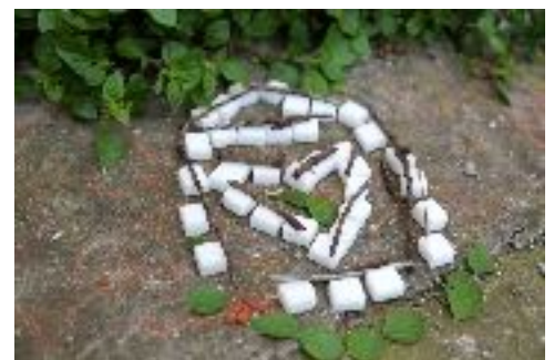
Voeu éphémère et "bricolé" dans l'enceinte du monastère de St-Georges (Istanbul)

À partir de plusieurs ethnographies menées dans des sanctuaires dits « partagés » par des fidèles de religions différentes dans l'espace euro-méditerranéen, cette communication interrogera plusieurs modalités de l'intense fabrique votive qui s'y déploie. Cette dernière est singulière car elle est productrice à la fois d' hétéropraxis et d' exopraxis (les exoprates « empruntant » le lieu de l'Autre). Dans quelles mesures ces pèlerins – la plupart étant des femmes – transigent ou transgressent-ils les prescriptions normatives des autorités religieuses respectives ?