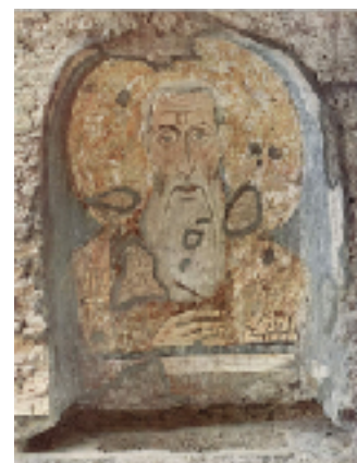
Fresque-icône de saint Cyr, atrium de l'église Santa Maria Antiqua, Rome

Dans les Miracles de Cyr et Jean , composés en Égypte par le futur patriarche de Jérusalem Sophrone au VII e siècle, se trouve la description de la pratique par laquelle des individus appartenant généralement à des couches sociales marginales se prêtaient, de manière apparemment professionnelle, à se rendre dans le sanctuaire des deux saints (à Ménouthis, à quelques km d'Alexandrie), afin de déposer des ex voto au nom de personnes ayant bénéficié d'un miracle de la part des saints, mais qui, pour des raisons diverses, ne pouvaient pas s'y rendre personnellement. Sophrone insère la description de ces pratiques dans un cadre narratif