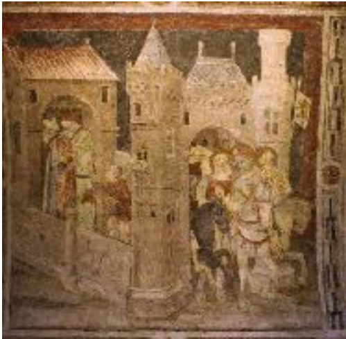
Les trois Doms, fresque de la collégiale Saint-Barnard, Romans-sur-Isère

Le mystère comme geste votif (France, XV e -XVI e s.) : quand jouer c'est croire, quand jouer c'est donner.