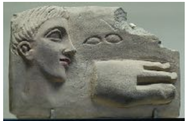
Plaque votive anatomique IIe s. ap. J.-C., Chypre, © Musée du Louvre.

Les recherches que nous avons conduites à Mexico sur les objets votifs, comme « choses » faites « objets » par le projet ou l'intention d'un « sujet » ont laissé dans l'ombre une quantité infinies de matériaux – nourritures, fleurs, cires brûlantes... –, destinées à une désagrégation rapide, et qui cependant marquent le passage dans le sanctuaire ou tout autre lieu de rendez-vous avec une puissance réceptrice et avec une communauté de partage. Comment penser cette fugacité ? Comment rendre compte ce qui ne reste pas, et qui pourtant marque le geste ? Quels types de recyclage engendrent la gestion de ces matérialités fugaces ? Et quelle économie du don met-elle en jeu ?