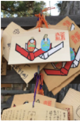
Plaquette de demande à la divinité « pour nouer un bon lien ». Grand sanctuaire d'Izumo, 2018

Qu'est-ce qu'un dévot, c'est-à-dire une femme ou un homme qui se voue par le moyen d'un ex-voto ? Ou plus précisément : comment un dévot sait-il ce qu'il est ou ce qu'il doit être pour en être un ? À cette question, toute une littérature prescriptive vient apporter des réponses, qui doivent s'efforcer d'articuler le plus étroitement la pratique des conduites et leur cadre général, leur finalité, leur efficacité supposée pour l'accomplissement des rites. Peut-on faire des lectures comparées de ces instruments « orthopraxiques ».